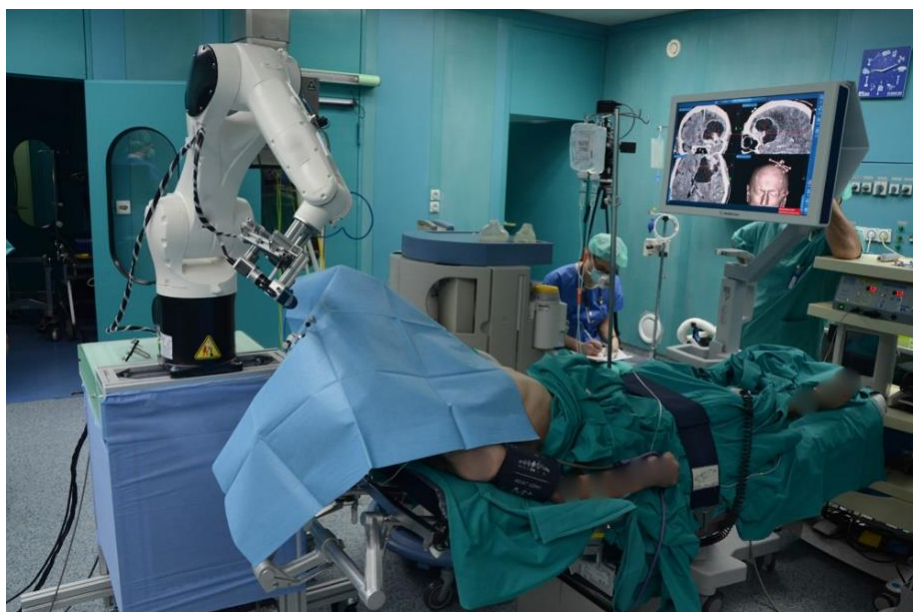
Slika 1: Robotska neuronavigacija: projekt FSB-a i KBD-a koji prethodi NERO projektu

Motivirani nedostacima postojeće tržišno dostupne opreme, INETEC je prijavio projekt razvoja neurokirurškog robota NERO – Neurokirurški robot u suradnji s istraživačkim organizacijama, Fakultetom strojarstva i brodogradnje Sveučilišta u Zagrebu (FSB) te Kliničkom bolnicom Dubrava (KBD). Projekt "NERO" je uspješno odobren ( https://www.inetec.hr/en/eu-rd-projects/nero/ ) i predstavlja svojevrsni slijed istraživačko-razvojnih aktivnosti u segmentu medicinske robotike te se nastavlja na prethodni uspješni projekt robotske neuronavigacije kojega su vodili FSB i KBD (Slika 1). Konzorciju se priključuje INETEC s obzirom na projektno iskustvo, kapacitete i infrastrukturu u području robotike.